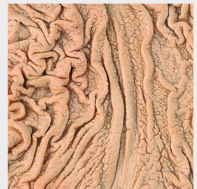
Gesunder Magen mit normalem Schleimhautrelief

Bildnachweis: Institut für Plastination, Heidelberg (5)