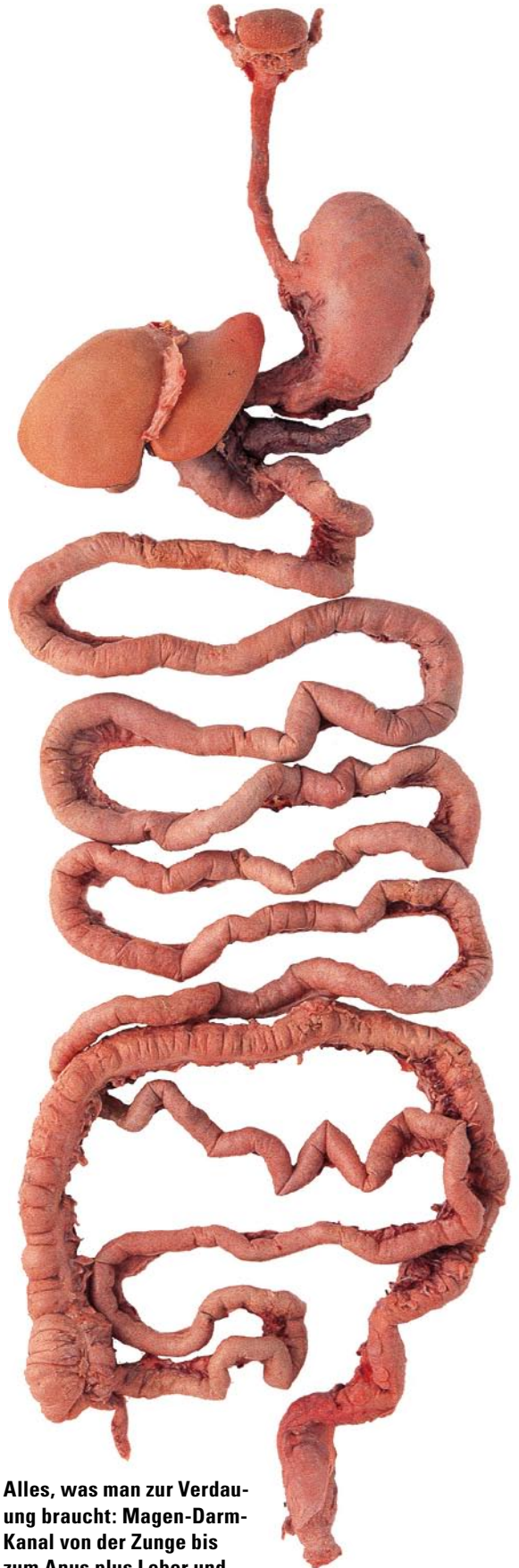
Alles, was man zur Verdauung braucht: Magen-Darm-Kanal von der Zunge bis zum Anus plus Leber und Pankreas.

Die häufigste Leberanomalie, die Fettleber, ist natürlich ebenfalls dabei. Und auch, was sich daraus entwickeln kann: die zirrhotische Leber. Diese erinnert an ein mit Seepocken überzogenes Boot. Wie massiv die fibrotischen Fasern das funktionelle Restgewebe einengen, wird im Schnittpräparat deutlich. ■