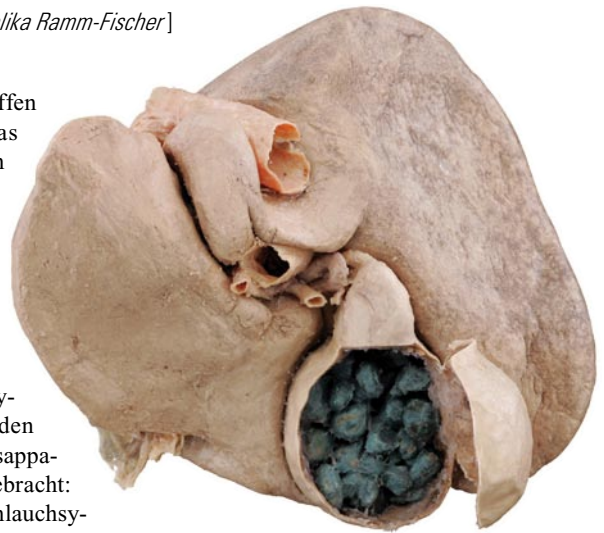
Leber in Dorsalansicht mit stein-gefüllter Gallenblase

Wie immer in der Ausstellung „Körperwelten“ sieht man die Anatomie mit anderen Augen als einst im OP, Präparations- oder Pathologiekurs. Die Darstellung ist ja auch ungewöhnlich: So hat man beispielsweise in ein Stück Dünndarm ein Fenster geschnitten, sodass man die Zotten und den Bürstensaum genau sieht. Der Katalog der Ausstellung erinnert daran, dass die Fläche der ausgebreiteten Zotten mehr als 200 m² beträgt. Was man leider nicht sehen kann, sind die physiologischen Leistungen dieser Schleimhaut: Die Zotten nehmen nicht nur die gespaltenen