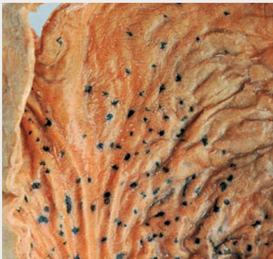
Gastritische Magenschleimhaut mit petechialen Einblutungen